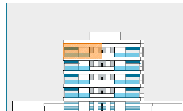
VIVIENDA TIPO - 3DORMITORIOS - PORTAL 1 / 4º A