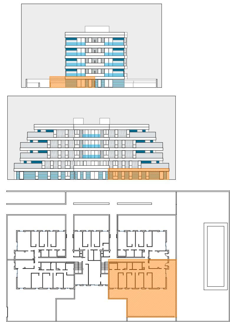
VIVIENDA TIPO - 4DORMITORIOS - PORTAL 2 / BAJO B